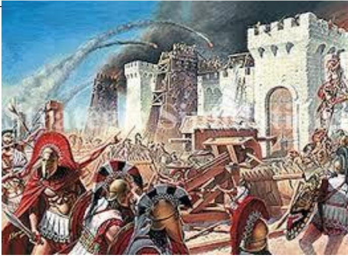
Attaque d'un château fort

Exerce-toi en répondant aux questions simples.