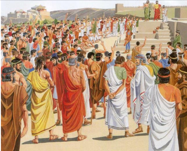
Discours à l'éclésià